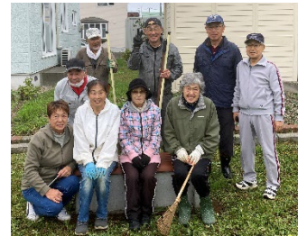
草刈り後にパチリ

本年から草刈り隊を結成し“ありんこ公園”の草刈りを5月から9月まで5回活動することが出来ました。公園の他にも空き地の草刈りやホール周辺、杣花壇の草刈りなども時間の許す範囲ではありますが生い茂った草を刈り取ることができました。刈った後の草集めにも皆様のご協力をいただき本当に有り難うございました。来年については今年の結果を踏まえて活動範囲についても検討することとしています。 今年1年本当に御苦勞様でした。来年もよろしく願います。